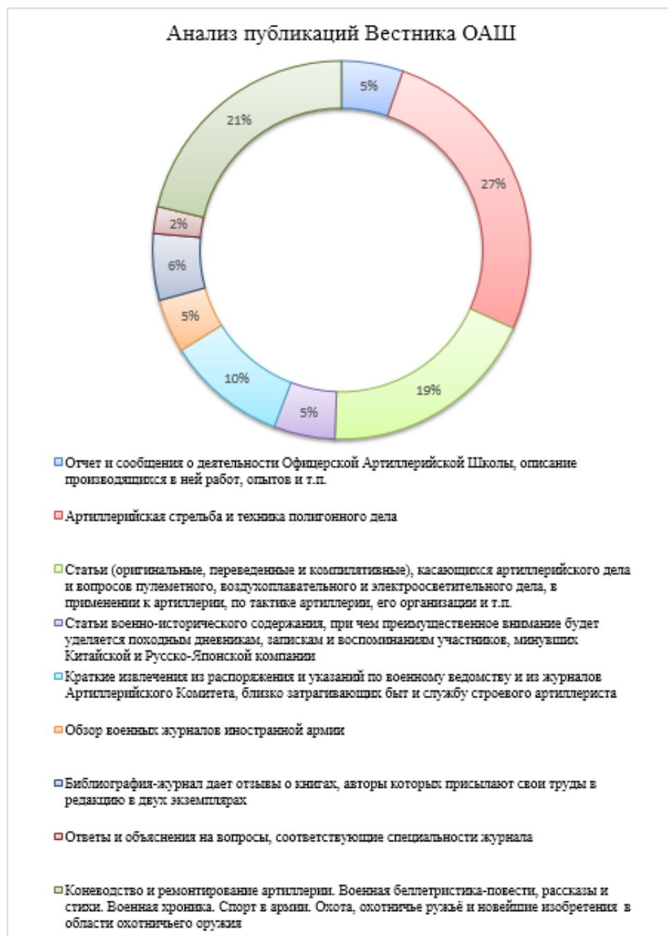
Диаграмма 1. Анализ публикаций Вестника ОАШ

При анализе всей приведённой выше информации можно сделать некоторые выводы: